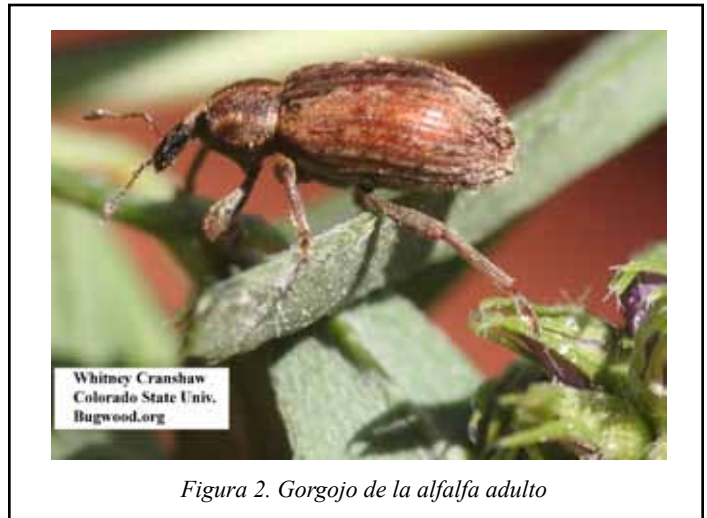
Figura 2. Gorgojo de la alfalfa adulto