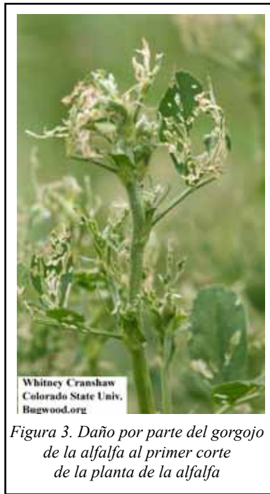
Figura 3. Daño por parte del gorgojo de la alfalfa al primer corte de la planta de la alfalfa

El gorgojo de la alfalfa no alcanza niveles de daños económicos cada año, por lo que los productores tendrán que depender del sondeo para determinar si los campos contienen poblaciones significativas del gorgojo. Una herramienta útil para determinar cuándo iniciar el sondeo en Pensilvania es el mapa del gorgojo de la alfalfa, el sistema PA-PIPE ( http://cas.psu.edu/spotlight/pa-pipe.html ). PIPE significa "Plataforma de Información sobre Plagas de Extensión y Educación". El PA-PIPE es un esfuerzo financiado por el Colegio de Agricultura de la Universidad de Penn State para predecir las poblaciones de plagas. Los cultivadores pueden comprobar página, que se actualiza continuamente, para ver cómo la población podría estar desarrollándose en su área del estado y entonces basar su exploración en estos modelos de predicciones.